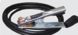
Cable Grapa a tierra 3m