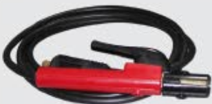
Cable Porta electrodo 3m