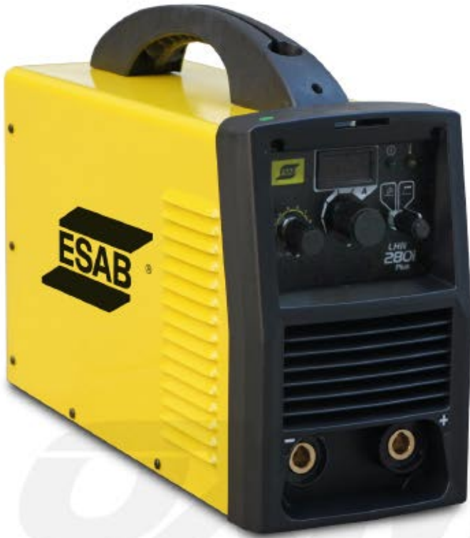
LHN 280i Plus

El inversor de soldadura LHN280i Plus es compacto e indicado para los servicios de herrería, reparación y mantenimiento leve.