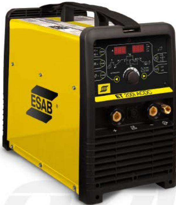
ET 200i AC/DC

La ET200i AC/DC es una máquina completa, con todos los recursos para soldadura TIG y Electrodo.