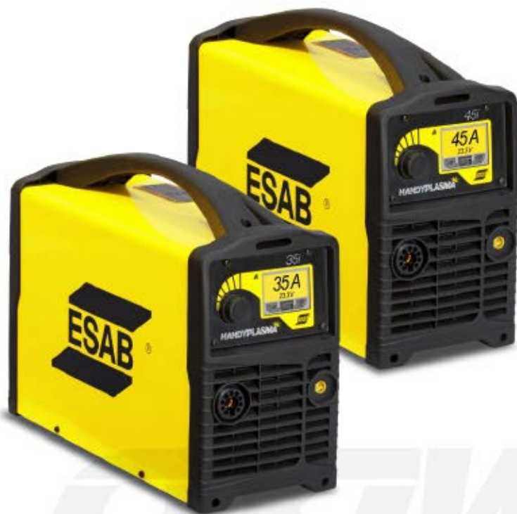
HandyPlasma 35i / 45i

Equipo inversor para corte plasma manual, ligera y portátil, con alimentación monofásica 220V 50/60Hz. Fácil de usar, con panel LCD a colores y todos los ajustes se pueden realizar con sólo un botón. No necesita ajustar el gas – la máquina detecta automáticamente la presión de entrada y salida. Sistema automático de purga del gas después del corte aumenta la vida útil de los consumibles.